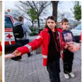
Li.: JRK-Gruppenbild; re.: Ausgabe der Haselnusschnitten

Gäste genossen auch die Unterhaltungen in Muttersprache.